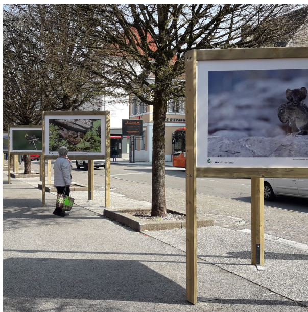
Création et fabrication de triptyques extérieurs

L'atelier de montage est équipé de : outillage de découpage, matériel d'assemblage, matériel pneumatique (cloueurs, agrafeurs, petites presses...).