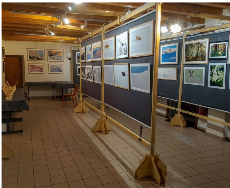
... et de panneaux d'exposition pour le FINA (Festival inter'nature)