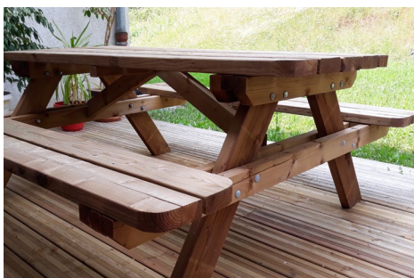
Table de pique-nique

Toutes les constructions sont en épicéa régional (certifié PEFC à 70%), traité autoclave (Tanalith®E sans chrome ni arsenic). Les éléments d'assemblage métalliques sont en inox ou traités anti-corrosion.